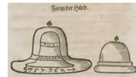
Bild: Darstellung eines Judenhutes aus der Frankfurter Juden Stättigkeit, 1613.