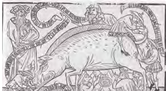
Bild: Druck eines „Judensau“-Holzschnitts aus dem 15. Jahrhundert.

Verbindung mit Schweinen zeigten, wurden nun auch an repräsentativen städtischen Bauten oder Privathäusern angebracht. „Judensau“-Motive kursierten auf Drucken und Grafiken, sie wurden in Bildergeschichten und judenfeindliche Holzschnitte integriert. Spätestens hier löste sich das Motiv aus dem kirchlichen Kontext und sickerte wirkmächtig in die Alltagssphäre ein. Es wurde zur allgegenwärtigen judenfeindlichen Referenz. Ende des 15. Jahrhundert können wir von einer neuen Qualität der Agitation durch solche Bilder sprechen. Exemplarische Beispiele sind etwa die Schriften und Stücke von Hans Folz, in denen die Verbindung von Juden und Schweinen beständig aufgegriffen wird. Zeugnisse einer spürbar schärferen Rhetorik gegenüber Jüdinnen und Juden sind aber auch die späten Schriften Martin Luthers.