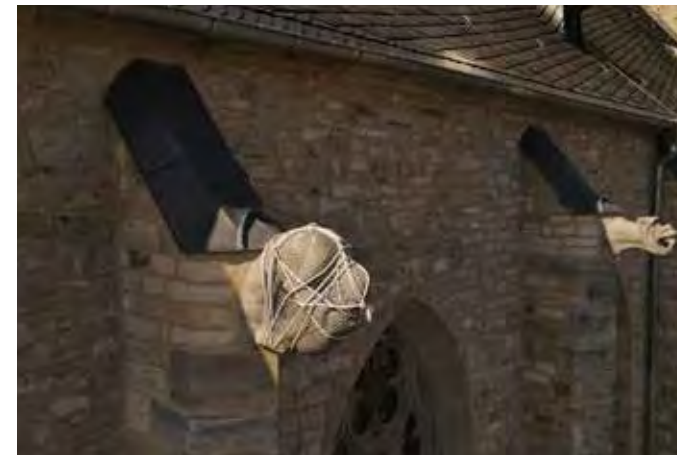
Bild: Mit Seil und Netz verhüllte Schmähplastik in Calbe.

Die Schmähplastik an der St. Stephani-Kirche ist heute verhüllt. Die Kirchengemeinde in Calbe möchte damit zum Ausdruck bringen, dass sie sich die judenfeindliche Aussage der Figur nicht zu eigen macht. Vorausgegangen waren dieser Entscheidung lange Diskussionen über den richtigen Umgang mit der Plastik. Im Rahmen des Projekts „sus et iudaei“ fand von Juli bis November eine Vortragsreihe zur Geschichte der Judenfeind-