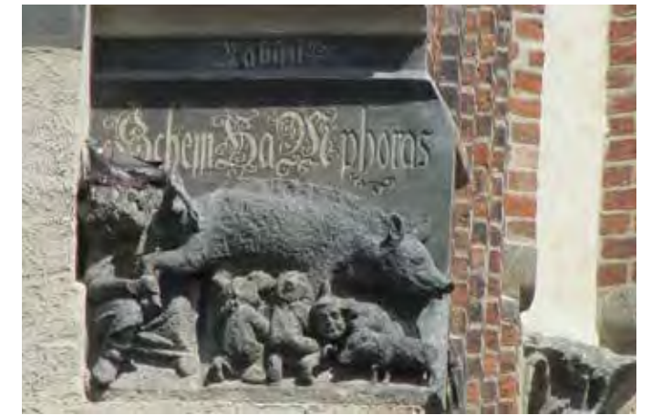
Bild: Judenfeindliche Schmähplastik an der Wittenberger Stadtkirche

schaft statt, um auf das Bildwerk und seine Aussage aufmerksam zu machen. Mit Fördermitteln des Soforthilfeprogramms „Kirchturmdenken“ konnte außerdem eine interaktive Webseite realisiert werden, die heute zusammen mit einer Faltbroschüre über den Figurenkranz und die antisemitische Darstellung an der Kirche informiert. Eine Metallstele unterhalb der Wasserspeier wird bald ebenfalls auf den antisemitischen Entstehungskontext der Figur hinweisen.