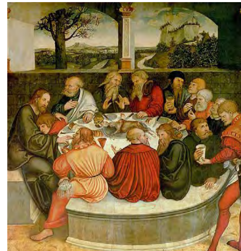
Bild: Mitteltafel des Wittenberger Reformationsaltars.

Dass sich die christliche Abgrenzung vom Judentum nicht nur in Schmähereliefs ausgedrückte, wird klar, wenn man in den Innenraum der Wittenberger Stadtkirche schaut. So findet sich auch auf dem Reformationsaltar der beiden Cranachs eine Abendmaldarstellung, die zeigt, wie tief antijüdische Stereotype im Christentum verwurzelt sind: Judas, hier zur rechten Jesu, wird als klassische Verräterfigur gezeichnet. Er ist zu diesem Zweck mit markanten, grimmigen Gesichtszügen ausgestattet, sein Geldbeutel, Ausdruck seines Verrats ebenso wie seiner Gier, ist sichtbar nach außen gekehrt. Nicht zufällig trägt er einen gelben Mantel, durch den er zusätzlich als von der Gemeinschaft der Jünger separiert erscheint. Im ausgehenden Mittelalter