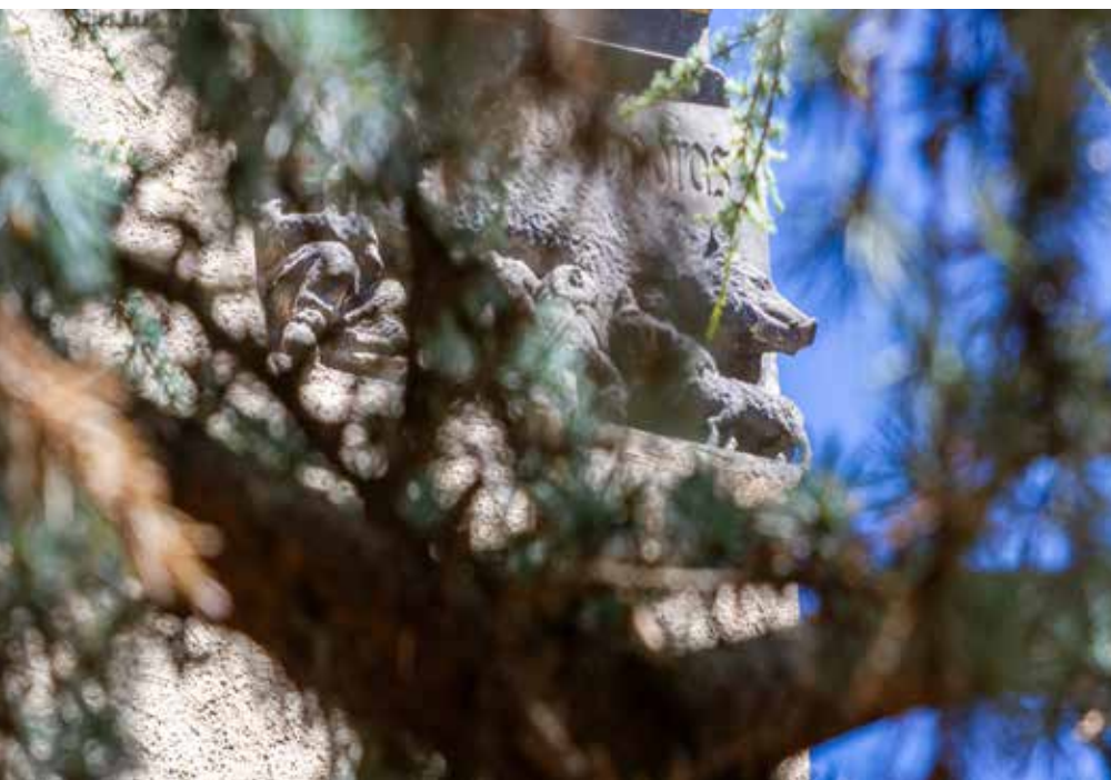
Bild: Judenfeindliches Relief an der Wittenberger Stadtkirche.