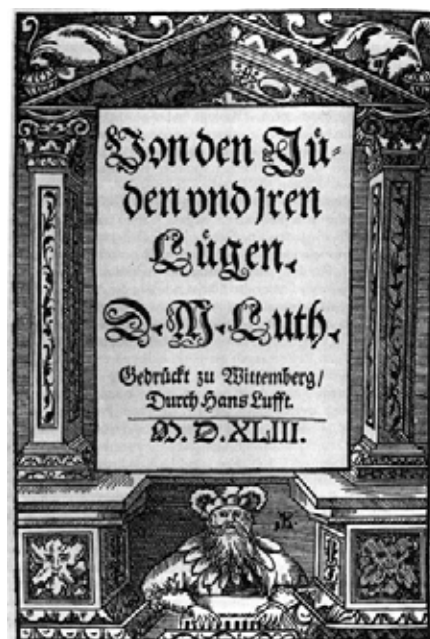
Bild: Titelbild von Martin Luthers „Von den Juden und ihren Lügen“, 1543.

„Es ist hier zu Wittenberg an unserer Pfarrkirche eine Sau in Stein gehauen. Da liegen junge Ferkel und Juden darunter, die saugen. Hinter der Sau steht ein Rabbiner, der hebt der Sau das rechte Bein empor, und mit seiner linken Hand zieht er den Bürzel [= den Schwanz] über sich, bückt [sich] und guckt mit großem Fleiß der Sau unter den Bürzel in den Talmud hinein, als wollte er etwas Scharfes und Sonderliches lesen und ersehen. Daselbst haben sie gewisslich ihr Schem