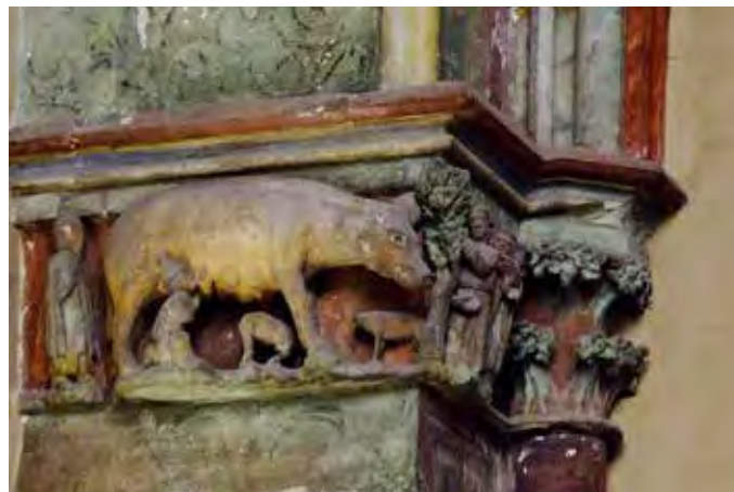
Bild: Schmähpplastik im Magdeburger Dom.