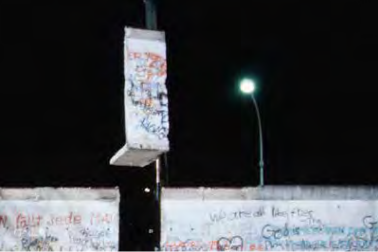
Bild: Die Berliner Mauer im Dezember 1989. CC BY-SA 2.0, Foto: Raphaël Thiémarc. Quelle: https://commons.wikimedia.org/wiki/File:Berlin_1989,_Fall_der_Mauer,_Chute_du_mur_22.jpg

und Entnazifizierungsverfahren in beiden deutschen Staaten ungeschoren davongekommen. Und machten Karriere, bis weit in die 1980er und 1990er Jahre hinein. Die nationalsozialistische Vergangenheit – präsent war sie trotz der Zäsur im Jahre 1945 also noch immer. Allerdings schien sie für viele Deutsche in Ost und West keine unmittelbare Bedeutung für ihre Gegenwart darzustellen. Schon gar nicht 45 Jahre später, im frisch wiedervereinigten Deutschland, wo doch ganz andere Themen im Vordergrund standen: Privatisierungsmaßnahmen, Währungsreform, Angleichung der Lebensverhältnisse. Unter diesen zugespitzten Bedingungen zeigte sich ab 1989, was vorher nie weg gewesen war, sich nun aber öfter und gewaltsamer artikuliert. Kein Jahr nach dem Mauerfall und noch in der Nacht der Wiedervereinigung brannte es in der Bundesrepublik. In Magdeburg griffen Neonazis ein Wohnheim vietnamesischer Vertragsarbeiter an, in Zerbst ließen 200 Menschen ein besetztes Haus in Flammen aufgehen, in Rostock mussten 25 jüdische Spätaussiedler in Sicherheit gebracht werden. Insgesamt 30 rechte Gewaltakte verzeichnet die Initiative „zweiteroktober90“ bundesweit in nur dieser einen Nacht des 2./3. Oktobers. Nationalismus und rechte Gewalt hatten im Zuge der Wiedervereinigung neuen Nährboden bekommen. Und die Befürchtungen derjenigen, die bereits vor 1989 vor den Gefahren eines neu aufflammenden deutschen Nationalismus gewarnt hatten, schienen sich zunehmend zu bestätigen.