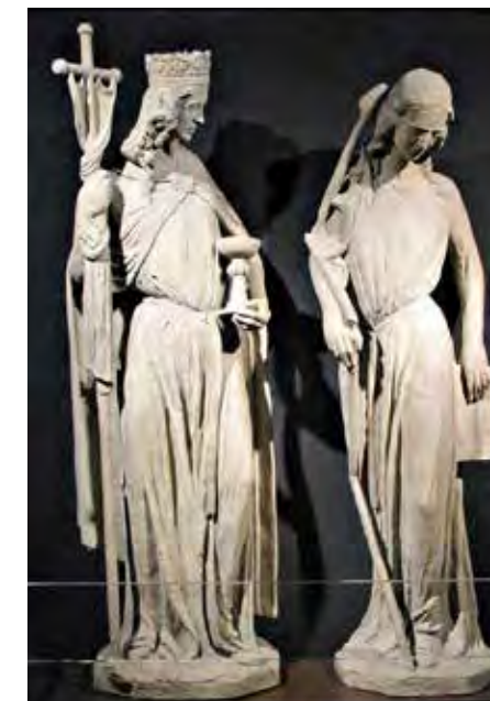
Bild: Ecclesia und Synagoga, Nachbildungen der Figuren vom Straßburger Münster im Diaspora Museum, Tel Aviv.

Ab dem 15. Jahrhundert verselbständigte sich das Motiv dann gewissermaßen. Schmähbilder, die Juden in