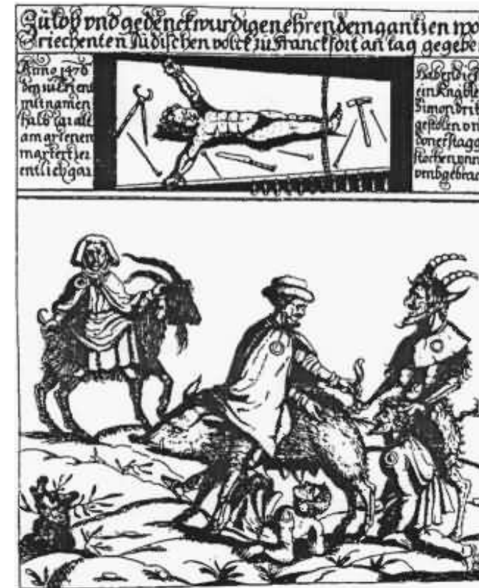
Bild: Darstellung des Frankfurter Schmähbilds, Kupferstich aus dem 18. Jahrhundert.

Spätestens hier sind wir mitten in der beginnenden Moderne angekommen und weit weg vom Entstehungszeitraum des Reliefs im Spätmittelalter. 1879 gründete Wilhelm Marr die sogenannte Antisemitenliga und gab dem uralten Judenhasse einen neuen Namen und eine neue Stoßrichtung. Noch um 1900 ereignete sich im Westpreußischen Konitz ein weiterer folgenschwerer Ritualmordvorwurf, der zur Stigmatisierung preußischer Jüdinnen und Juden und zum Abbrennen der dortigen Synagoge führte. Dass sowohl der Ritualmordvorwurf als auch das bekannte Motiv, das Juden in Verbindung mit Schweinen zeigt, feste Bestandteile antisemitischer Mobilisierung im ausgehenden Kaiserreich als auch der Weimarer Republik waren, sei hier nur am Rande erwähnt. Im Nationalsozialismus waren beide prominent eingebunden in die Regimepropaganda und begleiteten als solche die Verfolgung und Ermordung von Millionen Jüdinnen und Juden.